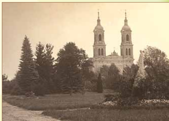
Kościół Wniebowzięcia NMP w Szymanowie. Lata 50. XX wieku.

Po ukazie carskim w 1864 roku Szymanów stał się siedzibą gminy. Gmina Szymanów liczyła wtedy 9189 mieszkańców i miała powierzchnię ok. 50 km 2 . Z powodów lokalowych w latach 1868–1871 Urząd Gminy Szymanów miał swoją siedzibę