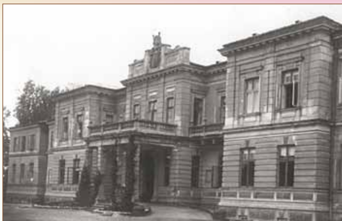
Pałac Lubomirskich w Szymanowie (dziś klasztor Sióstr Niepokalanego Poczęcia Maryi Panny). Lata 50. XX wieku.