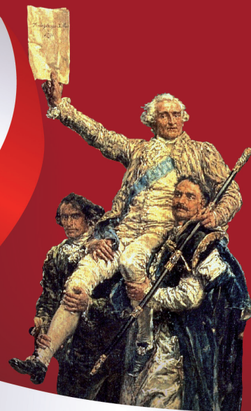
fragment z obrazu „Konstytucja 3 Maja 1791” autorstwa Jana Matejki