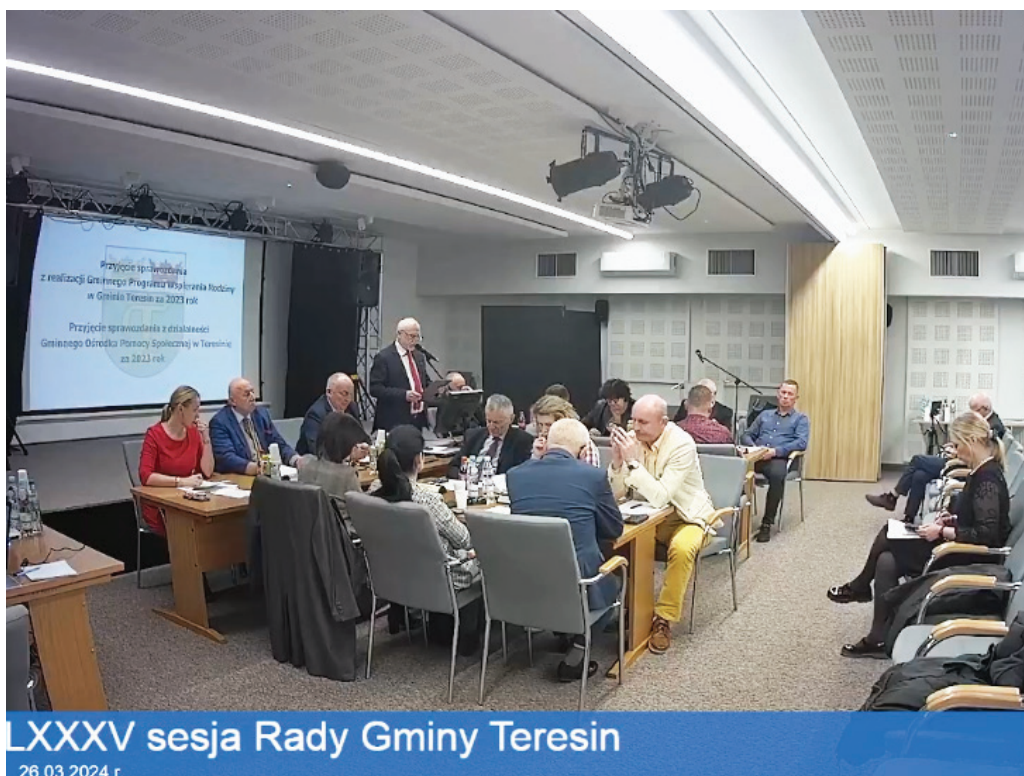
LXXXV sesja Rady Gminy Teresin

Sesję zakończyły informacje Przewodniczącego Rady Gminy i wójta o ich działaniach w okresie międzysesyjnym.