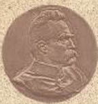
JÓZEF PIŁSUDSKI 1867 - 1935

Po zakończeniu uroczystości zapraszamy na gorącą grochówkę . Uczestnikom „Marszu Niepodległości” zapewniamy powrót autobusem z Szymanowa do Teresina.